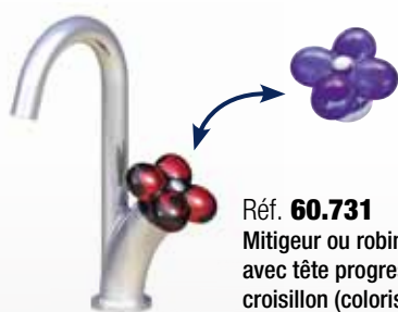
Réf. 60.731 Mitigeur ou robinet de lave-mains avec tête progressive et son croisillon (coloris à préciser)